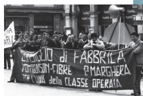
Consiglio di Fabbrica della Montefibre