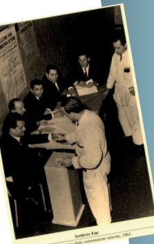
Anni 50. Votazioni Comm. Interne in Fiat